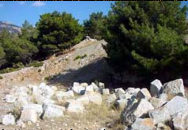
είναι η βάση του ορεινού οικισμού της Ορεινής Μεγαπρωι, ταχώς να ονομαζόταν ορεινή Μεγαπρωι, ορεινή