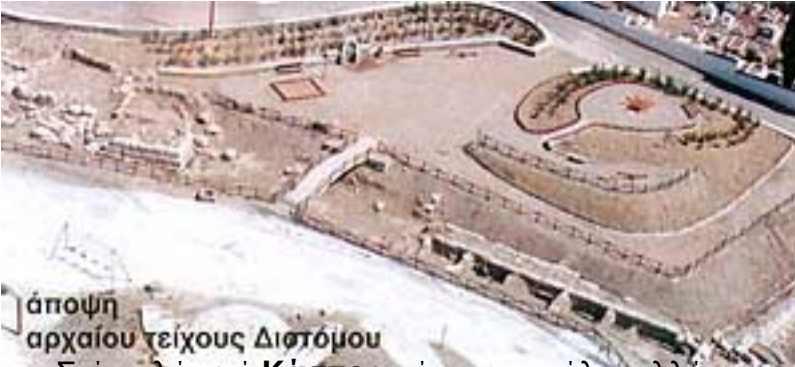
Άποψη αρχαίου τείχους Διοτόμου

Επί της περιοχής Κάστρο μέσα στη πόλη αλλά και στην Παιδική Χαρά υπάρχουν σε