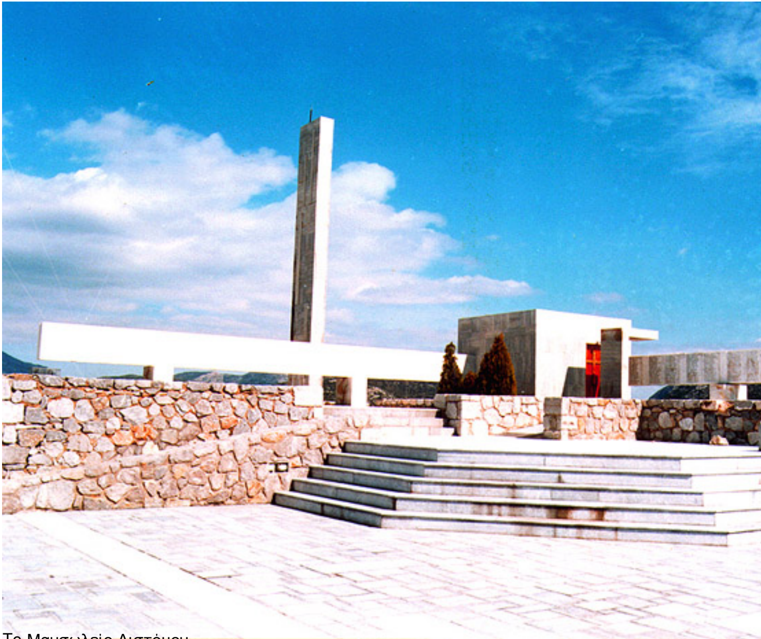
Το Μουσείο Αγνωστού