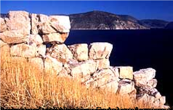
Επίγραμμα στον Άρη στην Πύλη του Πύργου στην Ακρόπολη της Πάφου, 500 περίπου χρόνια Ν.Ε. (Σύμφωνα με το