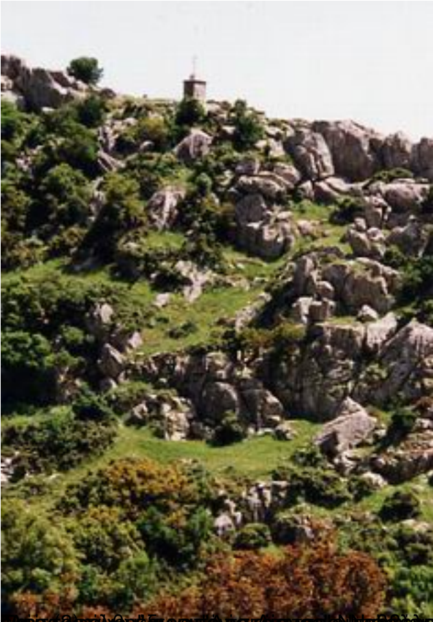
καθίσταται ο ορεινός οικισμός της Ορεινής Μεγαπρωι.....