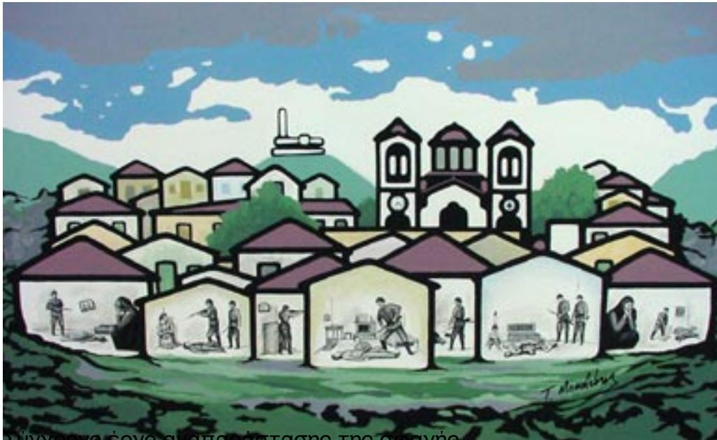
Σύγχρονο έργο αναπαράστασης της σφαγής

Δευτέρα, 08 Ιούνιος 2009 12:52 - Τελευταία Ενημέρωση Τρίτη, 10 Απρίλιος 2012 15:19